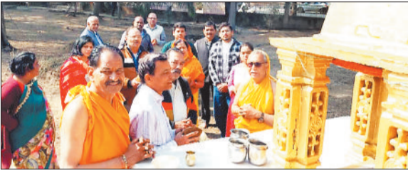
पूजा अर्चना करते समाज के सदस्य।