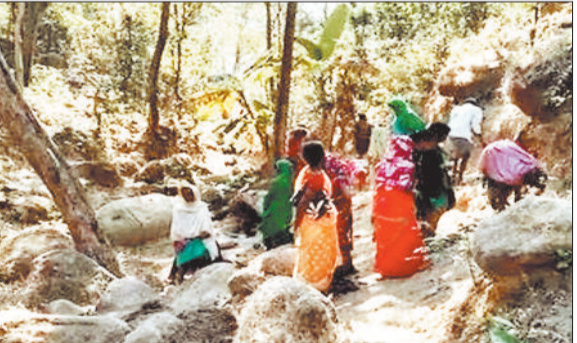
शराब भट्टी को नष्ट करती महिलाएं।

हाथों में डंडे लिए महिलाओं को देखकर अवैध महुआ शराब बनाने और बेचने में जुटे लोग मौके से फरार हो गए। इसके बाद महिला समिति ने जंगल में छिपाकर रखी गई भट्टियों और तैयार की जा रही अवैध शराब को खोज-खोजकर