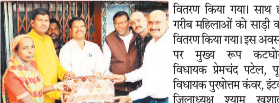
हरिभूमि न्यूज ▶▶ हरदीबाजार

दुर्गा उत्सव समिति बस स्टैंड हरदीबाजार व हनुमान भक्तों के द्वारा गुरुवार को संकट मोचन हनुमान मंदिर बजरंग चौक सराईसिंगर में हनुमान जी की विशेष पूजा पाठ किया गया। इसके उपरांत खीर पूरी प्रसाद का वितरण किया गया। बुजुर्ग महिलाओं को टंड से बचने के लिए कंबल का