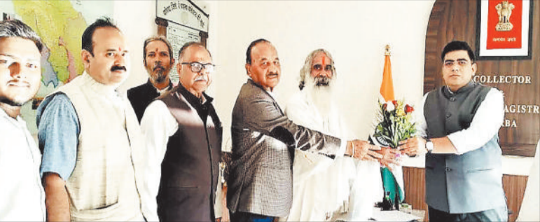
नगमा हसदेव सेवा समिति के सदस्यों ने कलेक्टर को ज्ञापन सौंपा है।