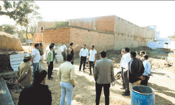
कार्यवाही करने पहुंची टीम।