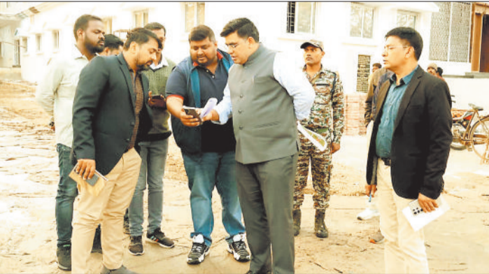
निरीक्षण करते कलेक्टर एवं अन्य।

निरीक्षण के क्रम में कलेक्टर ने नगर निगम के नवीन सभागार भवन का विशेष रूप से अवलोकन किया और निर्माण कार्य की विस्तृत जानकारी ली। उन्होंने सभागार के बाह्य हिस्से को आकर्षक स्वरूप देने हेतु रंग-रोगन एवं लाइटिंग व्यवस्था बेहतर