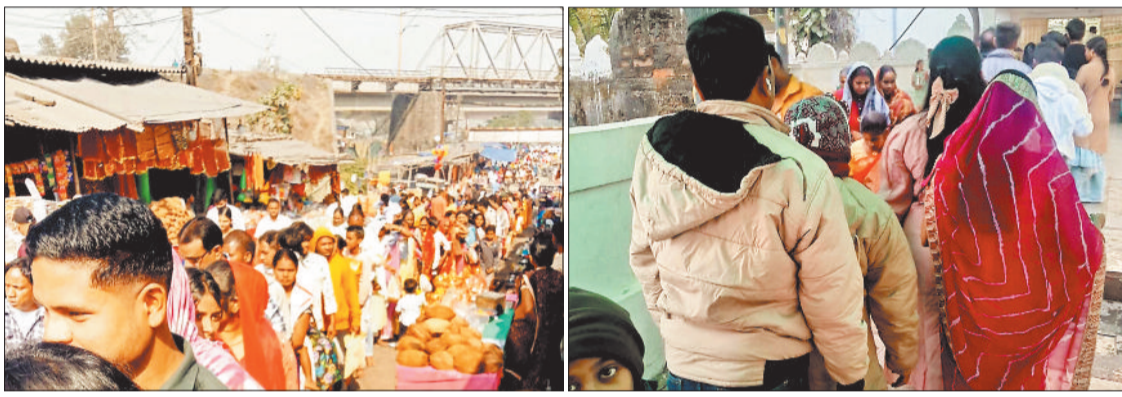
सर्वमंगला मंदिर के बाहर भक्तों की भीड़।