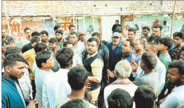
ग्रामीणों से बातचीत करते एसईसीएल के अधिकारी।

एसईसीएल दीपका परियोजना के विस्तार में बाधा बन रहे अवैध निर्माणों पर जिला प्रशासन ने अब तक की सबसे बड़ी कार्रवाई करते हुए हरदी बाजार और सरईश्रृंगार क्षेत्र में धड़ल्ले से जारी निर्माण कार्यों पर रोक लगा दी है। कोल धारक अधिनियम की धारा 9 के प्रकाशन के बाद भी प्रभावित क्षेत्रों में किए जा रहे अवैध निर्माणों को देखते हुए कलेक्टर कुणाल दुदावत के निर्देश पर यह कार्रवाई की गई। प्रशासन ने स्पष्ट कर दिया है कि अधिग्रहित भूमि पर धारा 9 के बाद किए गए