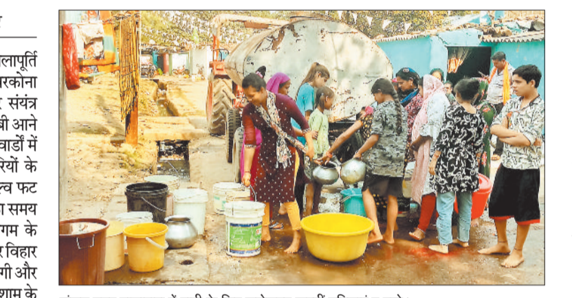
संजय नगर तालापारा में पानी के लिए जद्दोजहद करती महिलाएं व बच्चे।

नगर निगम की 3 सौ करोड़ की जलापूर्ति व्यवस्था फिर पटरी से उतर गई है। बिरकोना स्थित अमृत मिशन के जल उपचार संयंत्र (डब्ल्यूटीपी) के वाल्व चैबर में खराबी आने के कारण 1 जनवरी को शहर के कई वाडों में नल से पानी नहीं मिला। अधिकारियों के मुताबिक वाटर ट्रीटमेंट प्लांट का वाल्व फट गया है। इसके सुधार में एक सप्ताह का समय लगने की बात कही जा रही है। निगम के मुताबिक में इससे खास तौर पर व्यापार विहार पानी टंकी से पानी सप्लाई प्रभावित होगी और सुबह के समय ही पानी सप्लाई होगी। शाम के समय इसे बंद कर दिया जाएगा। इस तकनीकी समस्या के कारण तालापारा, मरी माई रोड, भारत चौक, कुम्हारपारा, ग्रीन पार्क कॉलोनी, अज्ञेय नगर, वाड नं. 27 विनोबा नगर, क्रांति नगर बैंक कॉलोनी, तारबाहर, शेष कॉलोनी और एफसीआई गोडाउन सहित 9 वाडों में जलप्रदाय प्रभावित हुआ है और 60 हजार से अधिक लोगों को परेशानी हो रही है।